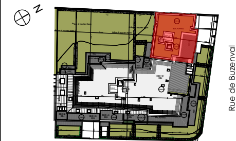
Avenue des Jockeys

119-125, rue de Buzenval 2-2b, avenue des Jockeys GARCHES 92380