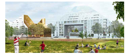
BATIMENT A4 - cage A