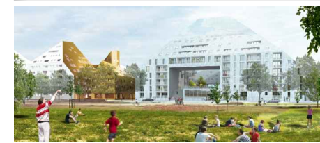
BATIMENT A4 - cage A