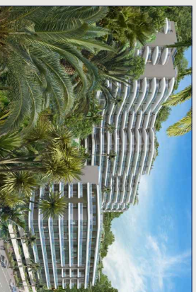
PHILIPPE BRACCOI.COM - ARCHITECTE D.P.G.