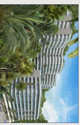
PHILIPPE BRACCO.COM - ARCHITECTE DPLG