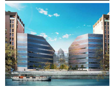
CLUSTER- FIDELIO II Appartement n° LB308 3ème étage