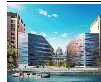
CLUSTER - FIDELIO I Appartement n° LA603 6ème étage