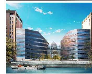
CLUSTER - FIDELIO I Appartement n° LA404 4ème étage