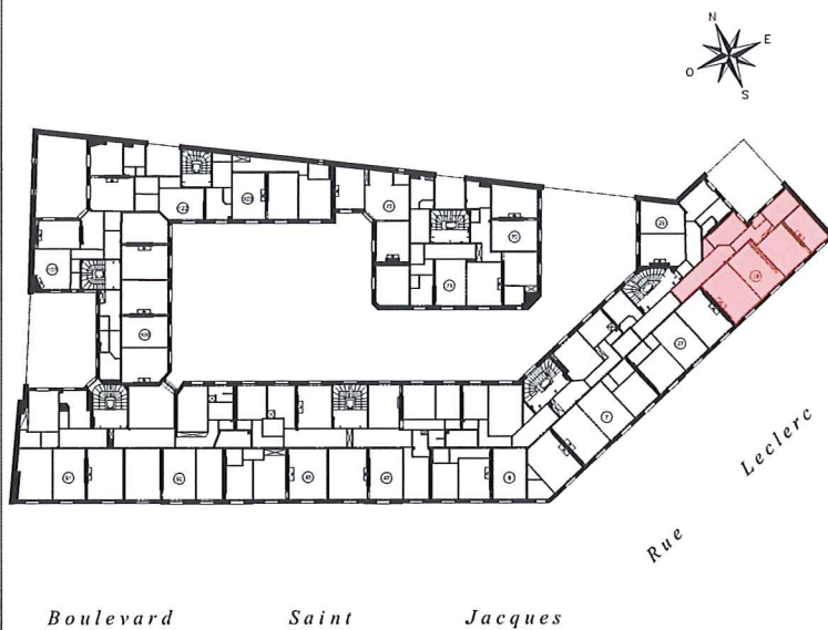
TABLEAU DES SUPERFICIES